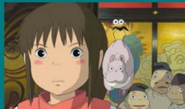
El Viaje de Chihiro

La madre de Billy ha muerto, y tanto su padre como su hermano mayor están inmersos en una de las huelgas de mineros más importantes de todos los tiempos. El padre de Billy lleva a su hijo al gimnasio para que aprenda boxeo, pero el chico quiere ser bailarín, algo que no está bien visto en su pueblo. ¿Conseguirá Billy vencer los prejuicios y alcanzar su sueño?