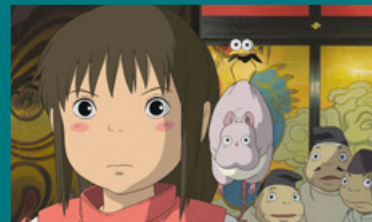
El Viaje de Chihiro

La madre de Billy ha muerto, y tanto su padre como su hermano mayor están inmersos en una de las huelgas de mineros más importantes de todos los tiempos. El padre de Billy lleva a su hijo al gimnasio para que aprenda boxeo, pero el chico quiere ser bailarín, algo que no está bien visto en su pueblo. ¿Conseguirá Billy vencer los prejuicios y alcanzar su sueño?